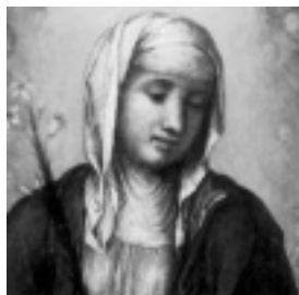
29 Aprile - S. Caterina da Siena, vergine e dottore della Chiesa. Patrona d'Italia e d'Europa